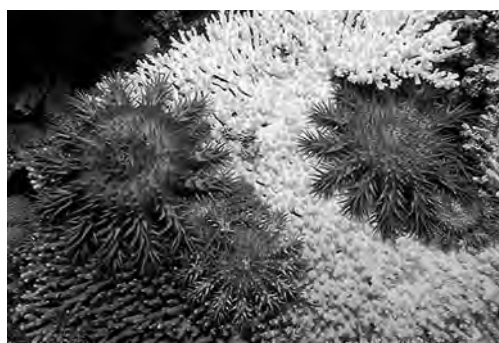
Acanthaster planci

Die Fotos wurden bereits in Documenta Homoeopathica, Band 26: Acanthaster planci. Arzneimittelselbsterfahrung mit dem Dornenkronenseestern veröffentlicht.